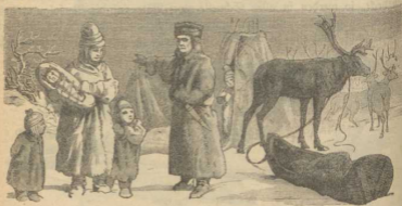
Das zahme Renttier.

4. Das Renttier. Was den Arabern das Kamel, das ist den Lappen das zahme Renttier. Es ist so groß wie ein starker Hirsch, aber sein Äußeres ist freilich nicht so anmuthig und zierlich; denn es hat einen kurzen dicken Hals und hält den Kopf in gebückter Stellung. Es trägt ein