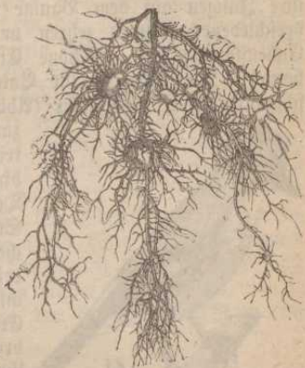
Bartflechte. \frac{1}{2} n. G.