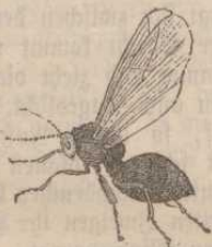
Die Gallwespe. 10\frac{1}{2} n. G.

2. Welche Menge von Tieren pflegt die königliche Eiche! Schnecken kriechen langsam empor, um von dem frischen Laube zu speisen. Unten lauert die Blindschleiche auf sie, um sie zu verspeisen, wenn sie gesättigt herabsteigen. Kleine Gallwespen laufen auf den Blättern hin und her und