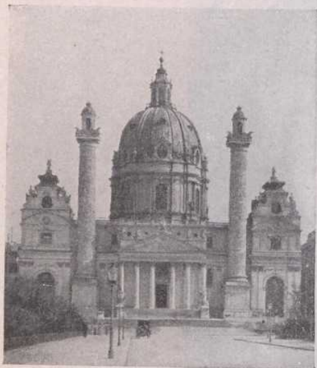
Abb. 36. Johann Fischer von Erlach: Karlskirche in Wien.