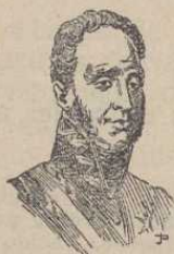
Francisco Espoz y Mina

cina ya dejó huellas profundas de su gran talento y asombrosa a-borriosidad. Las primeras eminencias del mundo se descubren ante el saber del gran histólogo, honra legítima de la Medicina universal. En 1906 se le concedió el premio Nóbel, la más alta consagración que la ciencia otorga al genio. A partir de 1892, desempeñó la Cátedra de Histología y Anatomía Patológica en la Universidad de Madrid.