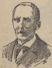
Domingo de Miguel

Domingo de Miguel. — Entendido economista y director de la Escuela Normal de Maestros de Lérida, nacido en el pueblo de Vilach por el año 1808. Sabio, virtuoso y de una honradez sin mancha. fué maestro de una generación de profesores y publicó varios libros que todavía merecen el favor del Magisterio español. Tranquilo y resignado como un santo, su alma hermosa voló a la eternidad en 1880.