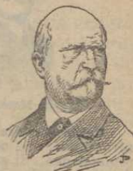
Manuel del Palacio