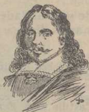
José de Ribera