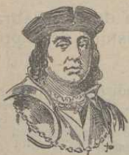
Francisco de Moncada

José de Ribera. — Inmortal pintor y grabador conocido por El Españolito , que nació en Játiva en 1588 y murió en 1656. Viviendo de limosna, pasó a Italia para estudiar a los grandes maestros de la pintura. Discípulo de Miguel Ángel y Caravaggio, sus méritos eminentes le elevaron a pintor de cámara del virrey de Nápoles. El Museo del Prado, de Madrid, posee más de cincuenta cuadros de tan famoso artista, cuyos lienzos conservan como tesoros de gran valor las más notables pinacotecas del mundo.