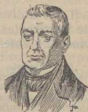
José Bernat Baldoví

José Bernat Baldoví. —Celebradísimo y popular poeta valenciano, nacido en Sueca en 1809. Fué autor muy fecundo, y en todas sus obras se admiran las raras cualidades de que se hallaba dotado para el género festivo, al que siempre se dedicó. Pasó a mejor vida en 1864.