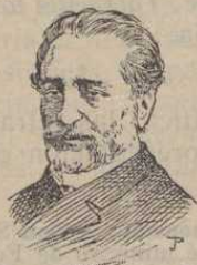
Práxedes Mateo Sagasta