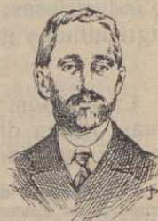
Manuel B. Cossío

Práxedes Mateo Sagasta. — Célebre político, ingeniero, académico y periodista, orador parlamentario, diputado, presidente del Consejo de Ministros en varias ocasiones, buen patriota, varón de grandes entusiasmos y jefe del partido liberal dinástico español. Nació en Torrecilla de Cameros en 1827 y falleció en 1903.