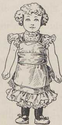
79. Eine Puppe.