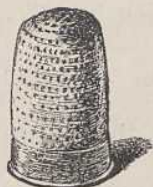
76. Ein Fingerhut.