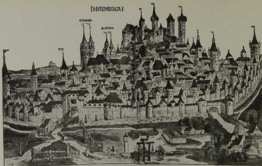
Fig. 85. Nürnberg nach Hartmann Schedel im Jahre 1493.

Beachte den doppelten Mauerzug, die hohen Kirchtürme und die alles überragende Burg im Hintergrunde.