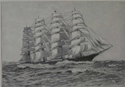
39. Viermastiges Segelschiff mit voller Takelage. Die Segelschiffahrt auf den Ozeanen hat seit dem Aufkommen der Dampfschiffe beständig abgenommen, aber keineswegs aufgehört, und auch die Ozean-Segler werden immer größer und dauerhafter gebaut. Für den Personenverkehr kommen sie allerdings kaum mehr in Frage, jedoch in beträchtlichem Maße für den Güterverkehr. An Schnelligkeit mit den Dampfern können sie freilich nicht weitteifern, haben aber den Vorzug, daß der Betrieb viel billiger ist.