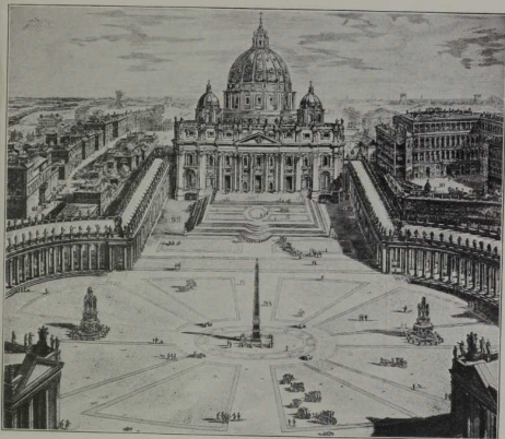
St. Peterskirche in Rom mit den Kolonnaden des Bernini.