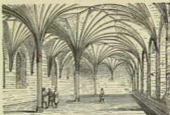
10. Kloster in Marienburg (siehe auch Tafel VII).