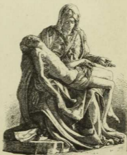
4. Pietà, von Michelangelo. (Rom.)