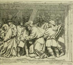
erste Station. Von Adam Kraft. (Nürnberg)