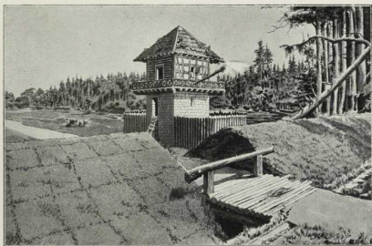
6. Römischer Grenzwall mit Graben und Warturm. (Nach Turris Limiti tutando destinata . Verlag von Fr. A. Perthes in Gotha.) Auf dem etwa 600 km langen Grenzwall befanden sich mehr als 1000 Wachtürmchen. Er begann bei Hünningen a. Rh. (10 km unterhalb der Mündung) und endete bei Reihheim a. d. Donau.