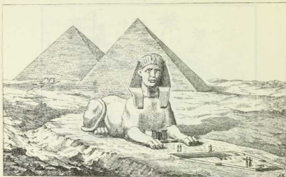
Fig. 4. Die Pyramiden und die große Sphinx von Gizeh. § 2. 1.