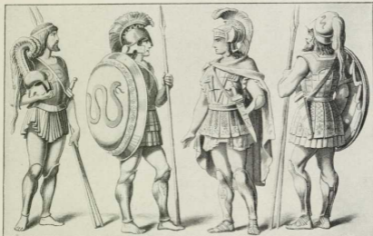
1. Griechische Krieger. Schutzaffen: metallener Helm mit Stirn-, Nacken- und Backenschirm und mit Schmutz aus Federn oder Rohhaar; Panzer aus Leder, besetzt mit metallenen Streifen und Schuppen; metallene Bein-schienen; schwerer Schild aus Leder und Metall. Angriffswaffen: Speiß zum Stoßen und kurzes Schwert.