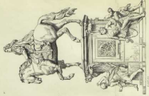
2. Reiter, Gruppe Thierdenkmal