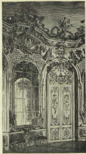
5. Was die Inschriften im Grottenhofe des Schlosses