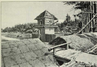
Römischer Grenzwall. (Nach Turris Limiti tutando destinata . Verlag von Fr. W. Perthes in Gotha.) Der über 500 km lange Limes bestand in seinen älteren Teilen meist aus einem ungefähr 4 m hohen Wall mit Graben und Pfahlwerk. Er wurde von häufigen Posten bewacht. Von den vielen Wachtürmen aus, deren einen das Bild zeigt, war ein Signaldienst nach rückwärts eingerichtet.