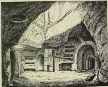
1. In den Katakomben zu Rom: Gruft der heil. Cäcilia.