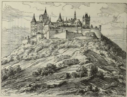
3. Die Burg Hohenzollern in ihrer jetzigen Gestalt.