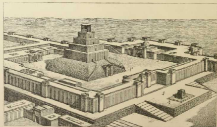
7. Assyrischer Tempel (nach Chipion.)