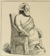
2. Gott Baal-Hammon.