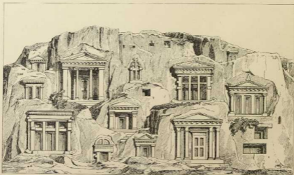
9. Lykische Todtenstadt. (Nach der Zusammenstellung von Fellows.)