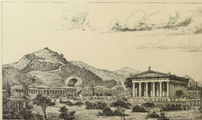
7. Ansicht von Olympia. Rekonstruktion von Bohn.