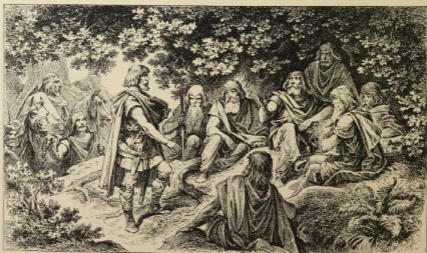
17. Germanische Ratsversammlung. (Nach einem Relief der Marc Aurelsäule).

Erklärung zu Fig. 1—12. (1, 2) Germanen mit Keule u. Schwölk. (3) Sarmatischer Panzerreiter. (4) Germane mit Feldzeichen. (5) Truppenführer.