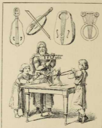
13. Kinderspiel und Musikinstrumente.