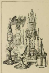
16. Gotisches Kirchgerät.