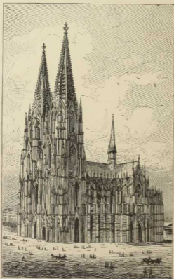
17. Der Dom zu Köln. gotischer Bau.