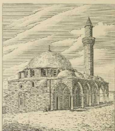
15. Othmanijje-Moschee in Aleppo.