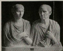
28. Bräutertanz eines römischen Ehepaars. (Vgl. S. 76.)