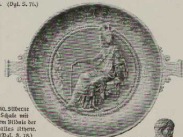
36. Silberne Schale mit dem Bildnis der Königin Athene. (Bgl. S. 18.)