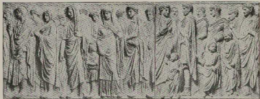
36. Etruskische Opferprozession vom Sclatensaltar des Hofers Angabus. (Bgl. S. 75.)