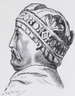
10—11. Karl der Große.

Die größere Abbildung zeigt eine kleine Bronzebildsäule, die, aus dem Domschatze zu Metz stammend, sich jetzt im Museum Carnavalet zu Paris befindet. Die kleinere Abbildung, der Kopf in Profil, läßt uns die charakteristische Kopftracht der Karolinger, das kurz geschorene Haupthaar und den Schnurrbart, noch deutlicher erkennen.