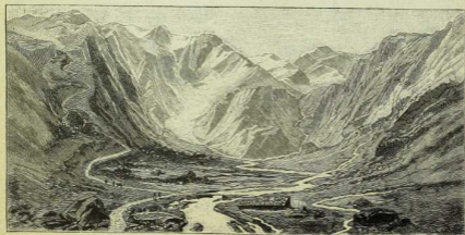
Fig. 247. Flußbildung aus Hochgebirgsbächen. Wasserfallboden im Pinzgau, im Salzburgerischen.