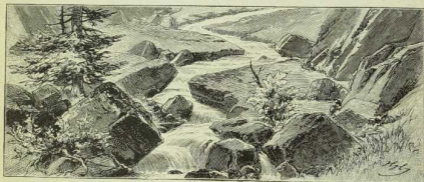
Fig. 246. Bach im Berglande.