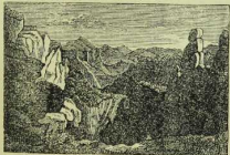
Fig. 26. Granit. Die Hofstrappe am Harz.