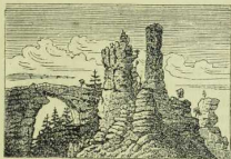
Fig. 22. Quadersandstein. Prebisch-Regel. Sächsische Schweiz.