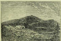
Fig. 24. Granit. Der Brocken.