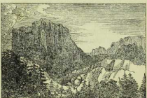
Fig. 25. Dolomit. Heil. Kreuzkofel. Südtirol.