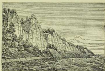
Fig. 23. Kreide. Küste von Rügen.