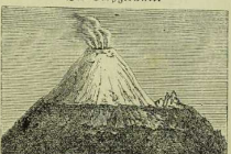
Fig. 29. Der Cotopaxi.