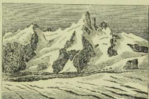
Fig. 27. Krystallinische Schiefer. Der Großglockner.