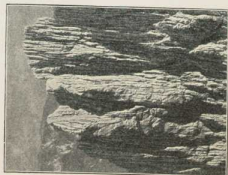
5. Fyr Kringstúfi bei Þófi im Solfommergati