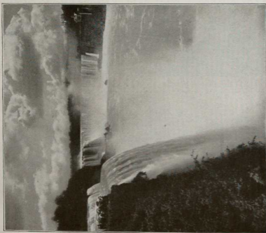
8. Die Niagara-Fälle, von der amerikanischen Seite aus aufgenommen. Zwischen Erie- und Ontario-See überwindet das „Donnerwoasser“ 400 m Höhenunterschied teils in Stromschnellen, teils durch die 50 m hohen Fälle. Hierin der 300 m breite „Amerikanische Fall“, hinter der 900 m breite kanadische „Südfelsenfall“. Rechts auf der Nordseite werden die Fälle von elektrischen Stromanlagen ausgenutzt.