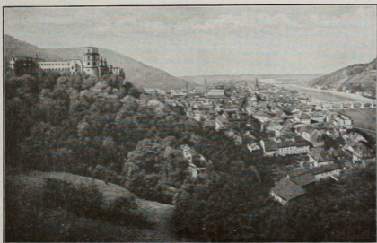
79. Heidelberg. Heidelberg ist diejenige deutsche Stadt, deren Lage nach Goethes Ausspruch etwas Ideales hat. Ihre zugleich großartige und anmutige Lage am Gebirge, in der Ebene und am Wasser, ihr mildes Klima, die üppige Fruchtbarkeit ihrer Umgebung, die Fröhlichkeit des Studentenlebens und der sadende Eindruck der herrlichen deutschen Schloßruine maßen „Alt-Heidelberg, die Feine“ zu einem Kleinod unter den deutschen Städten, das der Deutsche mit Scheffels Piede gern feiert: „Kein' andre kommt dir gleich!“