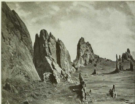
Der „Göttergarten“ im Felsengebirge bei Denver.