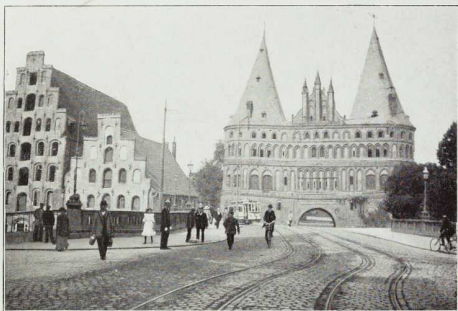
25. Das Holstentor in Lübeck.