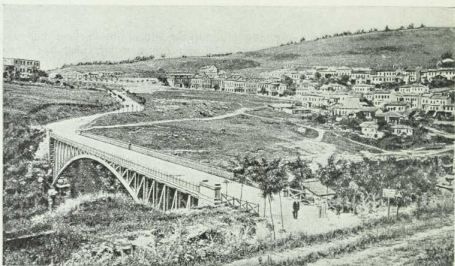
Tirnova (an der Jantza in Bulgarien) mit den Anklüpfen des Balkan. Von hier führt die Straße über den Schipapö (1333 m) nach Kasanlik an der Landzähe.