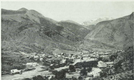
Partie aus dem Tiefsengebirge in Colorado.

Im Hintergrunde der schneebedeckte Pils Peak (4200 m) südlich von Denver, im Vordergrunde Manitou, ein Badeort.