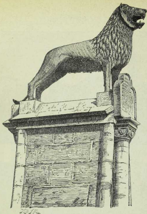
Löwe zu Braunschweig. 1166 von Heinrich d. L. errichtet.