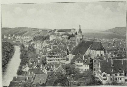
20. Tübingen, vom Osterberg aus gesehen. (Vgl. S. 10.)