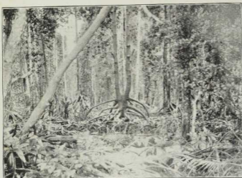
41. Mangrovesumpf an der Küste von Kamerun.