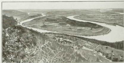
10. Windungen des Alabama-Flusses beim Austritt aus den südlichen Alleghanies.