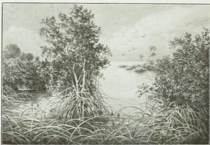
40. Strandsee mit Mangroven an der Küste von Neuguinea.

An den flachen Meerestüften der Tropenländer bildet die Mangrove Sumpfwälder. Die zur Ebbezeit über den Wasserpiegel herausragenden „Stehenwurzeln“ ähneln den Stäben eines aufgepannten Regenschirmes. Sie bringen dem Baume Salt im schlammigen Boden und fñhren ihm Luft zu.