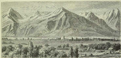
Gebirgsmasse aus Granit und Gneis: Höhe Tatra.