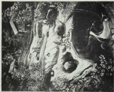
No. 11. Gletscherschliff und Gletschererosion: Der Gletschergarten in Luzern mit abgeschliffenen Felsflächen und Gletschertöpfen.