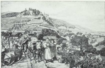
No. 44. Weinlese an der Hardt. (Nach dem Original von H. Striefler, Landau.)