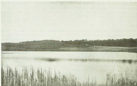
(Aus Wasmuths, Die Ursachen der Ederflüßengehaltung des Norddeutschen Tieflandes.) Grundmoränenlandschaft und Sehtjeer in Mecklenburg.