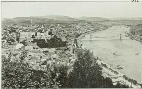
4. Budapest, von den Anlagen im Süden Zwischen dem auf welligen Hügeln gelegenen, von engen, krummen Gassen durchzogenen, altertümlichen Buda, in Straßen geschnittenen, modernen Pest wälzt die von zahlreichen Brücken überspannte, schiffbare Donau ihre ge- redengeschmückten und waldigen, an Heilquellen reichen Bergen geziert hat, ist Pest, an dessen Uferorte