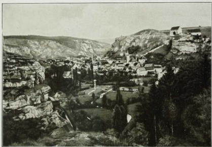
11. Pottenstein in der Fränkischen Schweiz. Durch die ausnagende Tätigkeit der Gewässer sind zwischen Bayreuth und Erlangen reizvolle Formen gebildet, die trotz ihrer mäßigen Höhe gewaltig wirken. Auf der Talsohle grüne Matten und freundliche Städtchen und Dörfer, auf den schroffen, oft blockförmigen Dolomitsfelsen Ruinen und Schlösser, in den Bergen zahlreiche Tropfsteinhöhlen.